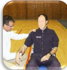
Mobilisation passive : méthode C.G.E