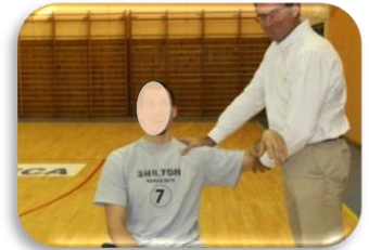
83° abd avant mobilisation