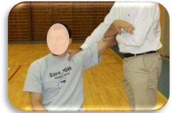
112° abd après mobilisation